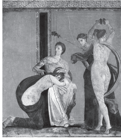
羅馬人在宗教節日會安排各類歌舞表演活動，這是在龐貝古城一幅描繪酒神節活動的溼壁畫

西元前6世紀，伊特拉斯坎人訂立了羅馬節，羅馬節主要是一種宗教祭祀的節日，在這節日中安排有歌舞或競賽等表演活動。到了西元前509年，羅馬重新拿回統治權，他們非但沒有撤除羅馬節，更增添許多不同的表演活動，爾後甚至連軍事勝利或婚喪喜慶都舉行大型的活動。早期為一年一齣戲，之後一年演出48天，最後在西元354年到達高峰，一年的演出日達175天。羅馬正規戲劇的演出時間也愈拉愈長，一齣戲最長可連續演出6天之久。