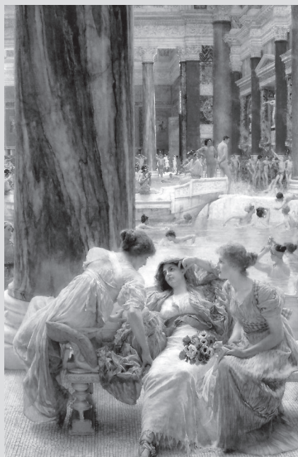
阿瑪—泰德瑪（Alma-Tadema）的《羅馬浴場》，讓人一窺古羅馬富裕中產階級的生活

羅馬喜劇的劇情多圍繞在富裕中產階級的生活，人物鮮明，其中最具畫龍點睛效果的，要屬奴隸這個角色，多數的故事都在述說兒子不顧父親反對而娶心上人，但總有聰明的奴隸在旁協助。所有喜劇幽默的來源都在奴隸這個角色上，最後則多以故人之子相認團圓收場，皆大歡喜。