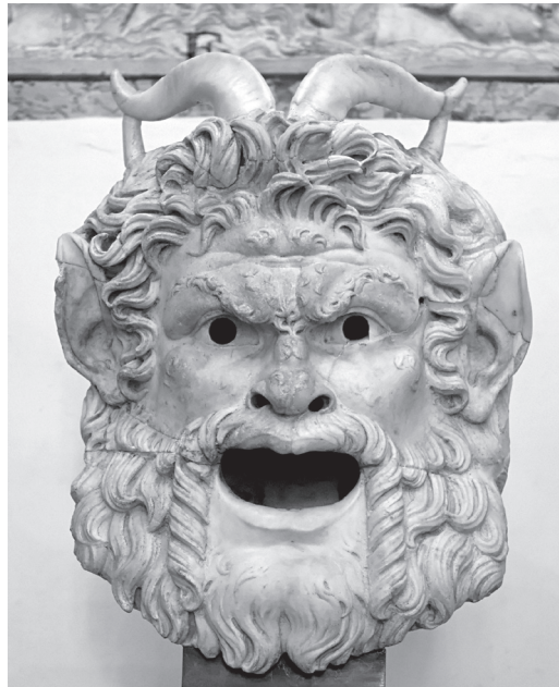
作於西元2世紀的大理石薩特面具，呈現當時的羅馬工藝

內容主題多難登大雅之堂，但觀眾仍偏好優劇的驚險刺激。優劇甚至有嘲笑宗教儀式的內容，當時基督教開始傳播盛行，優劇和教會之間曾引起不小爭端。