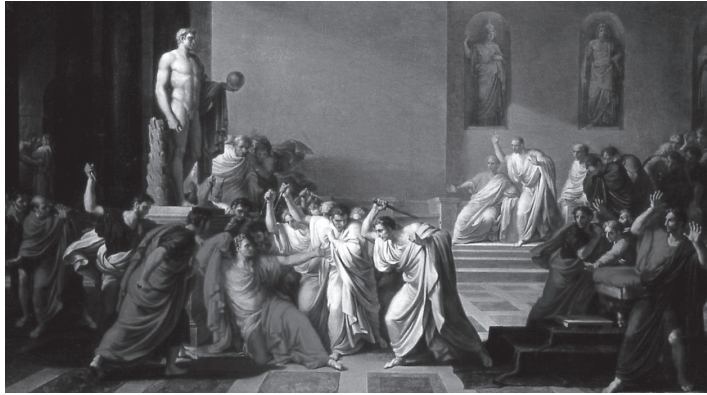
卡穆奇尼（Camuccini）的《凱撒之死》描繪西元前44年凱撒遭元老院成員暗殺的場面。凱撒死後，養子屋大維開創羅馬帝國，成為第一位帝國皇帝

計畫實現，之後的統治者也一一效仿，隨著疆土擴大而在各地興建劇場。羅馬帝國統治時期大約建立了125座永久性劇場，有些劇場至今仍保存良好。