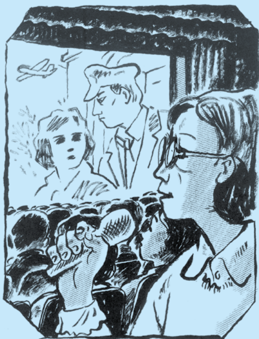
■「辯士」（右）為無聲電影解說劇情。 （林玫伶著《我家開戲院》）

第二次看電影是跟母親和六姨媽去的。影片裡的阿香失蹤了，她的母親雇人沿街敲鑼尋找。講電影的人索性帶著一面真鑼登場，鏗鏘（去尤）的敲了起來。因為音效逼真又有創意，全場觀眾都為他熱烈鼓掌。