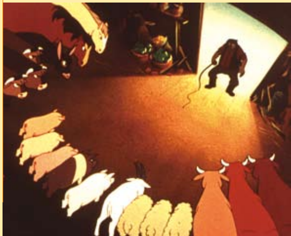
■酒鬼瓊斯凌虐農莊動物。