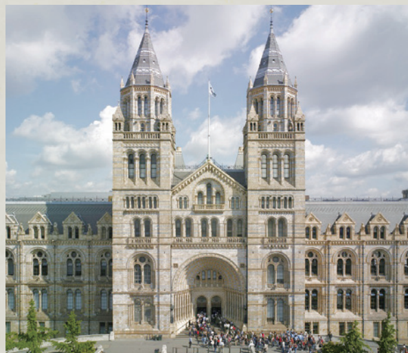
倫敦大英自然史博物館。

隨著標本館藏增加，博物館空間變得擁擠，在大英博物館自然史收藏品管理者——理查·歐文爵士鼓吹政府另闢空間保管之下，1881年大英博物館開放了自然史部門供大眾參觀，1992年更名為自然史博物館。